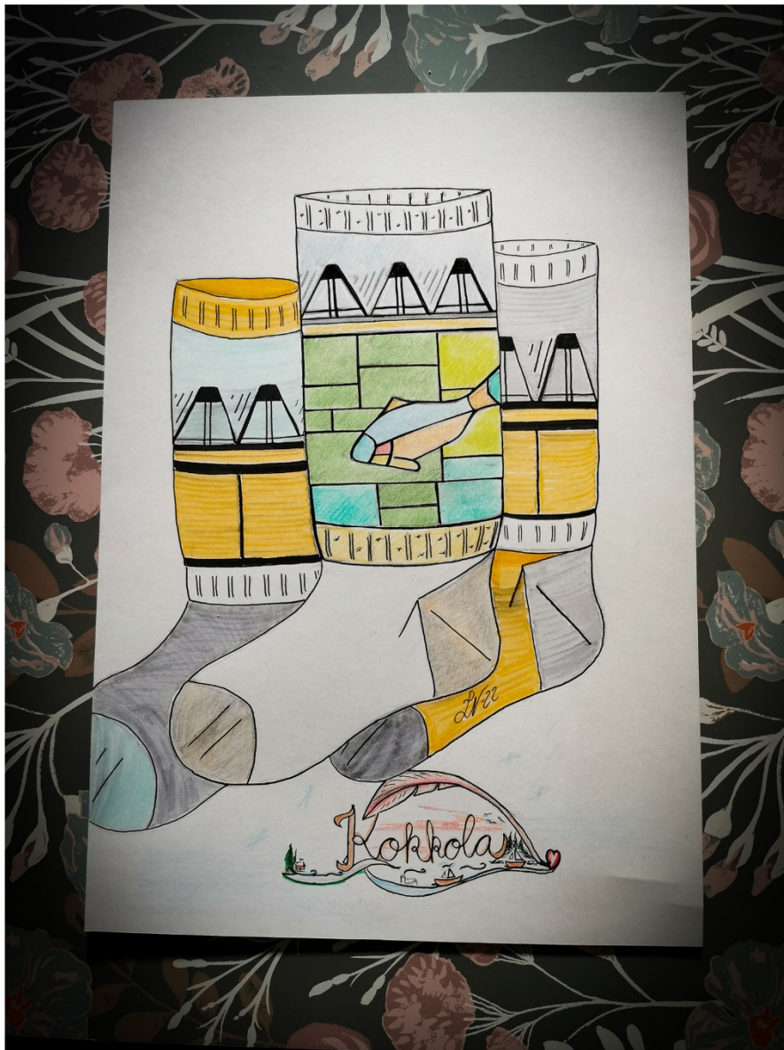
Protopiirros Kokkolan Kaupunginkirkko Ovista ja Ikkunoista - neulos-suunnitteluprojekti/ Leena Nikkinen